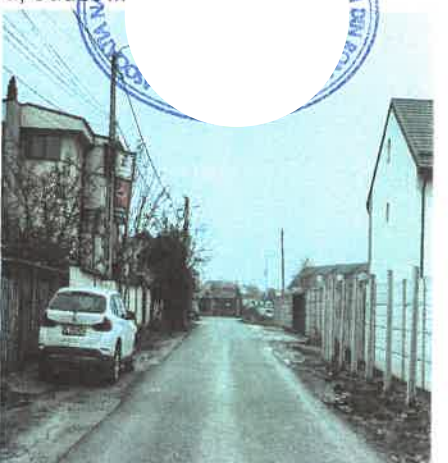
Coridor expropriere strada Parfumului, Oras Bragadiru, Judet Ilfov