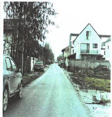
Coridor expropriere strada Parfumului, Oras Bragadiru, Judet Ilfov