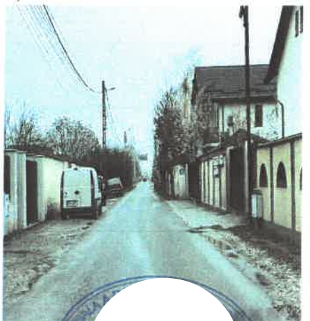
Coridor expropriere strada Parfumului, Oras Bragadiru, Judet Ilfov