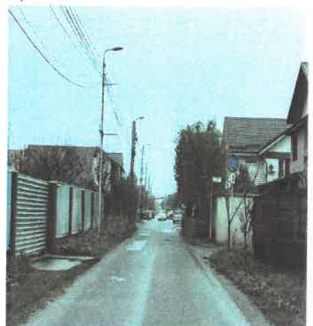
Coridor expropriere strada Parfumului, Oras Bragadiru, Judet Ilfov